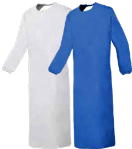
Boulogne - 8133A2FK0