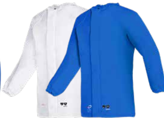
Morgat - 4391A2FK0