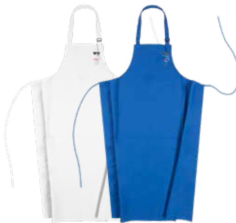
Nantou - 8195A2FK0