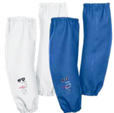
Cork (Kleen) - 8161A2FK0