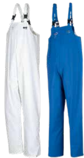
Killybeg - 6639A2FK0