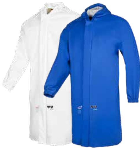
Rigi - 4415A2FK0